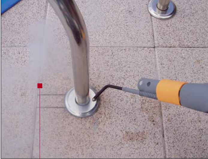
Über eine Lanze gelangt der heiße Dampf in jede Ritze